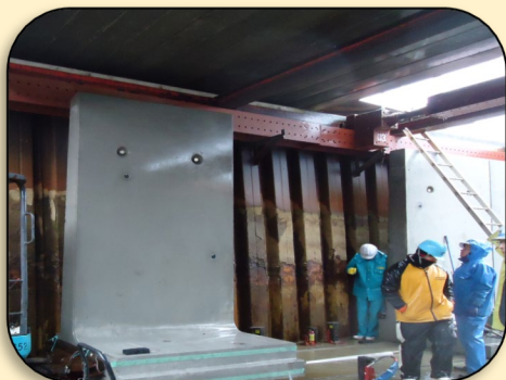
橋梁下・道路横断箇所